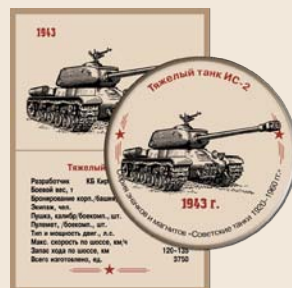
12. Тяжелый танк ИС-2