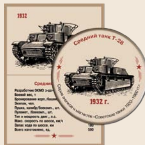
8. Средний танк Т-28