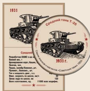
4. Средний танк Т-26 (с пушечным вооружением)