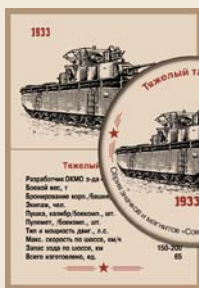
9. Тяжелый танк Т-35