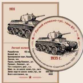
7. Легкий колесно-гусеничный танк БТ-7