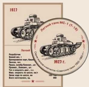
2. Легкий танк МС-1 (Т-18)