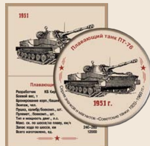
16. Плавающий танк ПТ-76