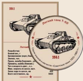
26. Легкий танк Т-60