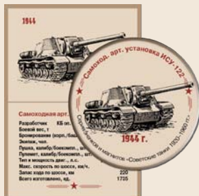
19. Самоходная артиллерийская установка ИСУ-122