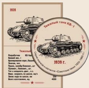
10. Тяжелый танк КВ-1