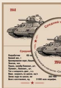
11. Средний танк Т-34