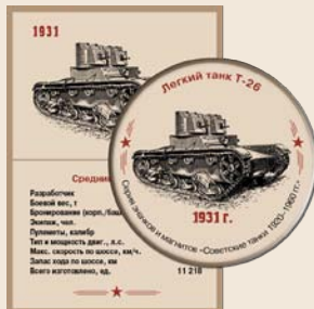
23. Легкий танк Т-26 (с пулеметным вооружением)