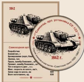
22. Самоходная артиллерийская установка СУ-122