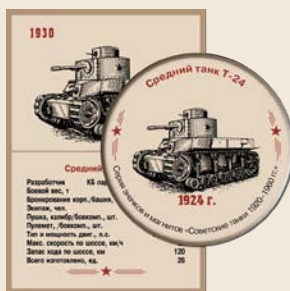
3. Средний танк Т-24