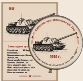
17. Самоходная артиллерийская установка СУ-100