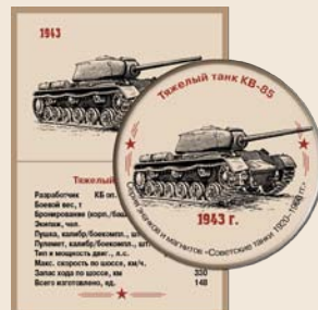
20. Тяжелый танк КВ-85