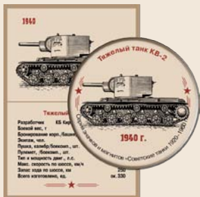
13. Тяжелый танк КВ-2