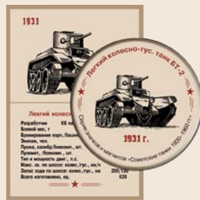
5. Легкий колесно-гусеничный танк БТ-2