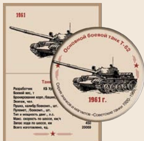
18. Основной боевой танк Т-62