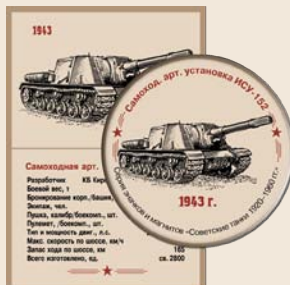
15. Самоход. арт. установка ИСУ-152