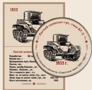
6. Легкий колесно-гусеничный танк БТ-5