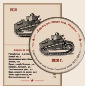
1. «Борец за свободу тов. Ленин»

О танках, танковых войсках, танкостроителях написаны книги, снято немало кинофильмов, Можно с уверенностью сказать, что коллекция значков и магнитов - это красивый и недорогой подарок для всех, кто интересуется техникой, историей своей страны и ее Вооруженных Сил.