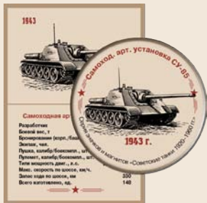
21. Самоходная артиллерийская установка СУ-85