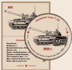
25. Средний боевой танк Т-55