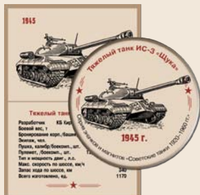
14. Тяжелый танк ИС-3 «Щука»