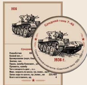
24. Средний танк Т-46